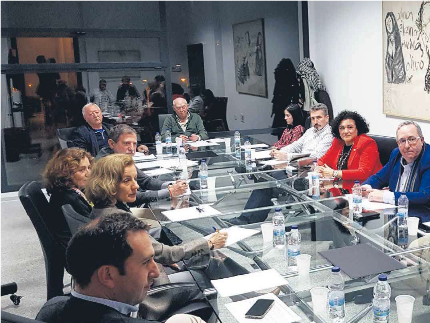
Asamblea anual de la Unión Interprofesional que integra a 17 profesiones